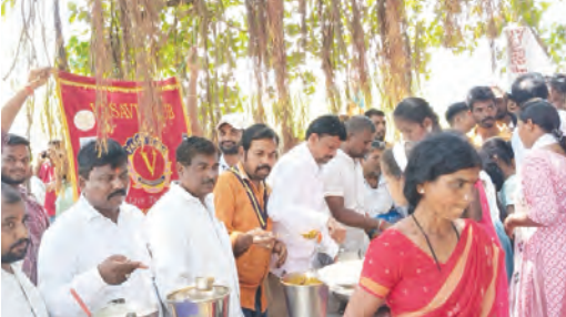
అన్నదానం నిర్వహిస్తున్న దృశ్యం