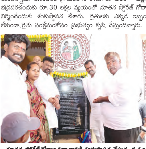
నూతన స్టోరేజ్ గోదాని నిర్మాణానికి శంకుస్థాపన చేస్తున్న దృశ్యం