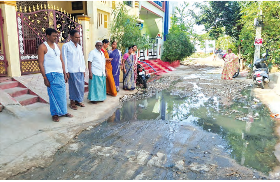
ఇళ్ల మధ్య నిలిచిన ములకినీరు

జులై 31 ప్రభాతవార్త: జులై మున్సిపాలిటీ పరిధిలోని పద్మావతి కాలనీ 23వ వార్డులో డ్రైనేజీ సమస్యలతో స్టానింగు వానా ఇబ్బందులు వదుతున్నాయి. సంవత్సరాలు గడుస్తున్న సమస్యకు పరిష్కారం దొరకకపోవడంతో ఇక అందోళన బాట పట్టారు. వర్షాకాలం వచ్చిందంటే చాలా భయాందోళన చెందుతున్నారు. జులై మున్సిపాలిటీ పరిధిలో పద్మావతి కాలనీ లో డ్రైనేజీ సమస్యతో అవస్థలు వదుతున్నారు. వర్షాకాలం వచ్చిందంటే కాలనీలో ఉన్న చెరువు నిండి అలుగునీరు సైతం డ్రైనేజీ కాలువలకు చేరడంతో ఉప్పొంగి ఇంట్లోకి నీరు చేరే పరిస్థితి ఏర్పడుతుంది. గత కొన్నేళ్లుగా ఇదే తరతు కొనసాగుతున్నది. గడిచిన రెండు మూడేళ్లలో చెరువు నీరు ఉప్పొంగి ప్రవహించి డ్రైనేజీ కాలువలను నిండి రోడ్లపైకి కూడా రావడంతో కాలనీ మొత్తం చెరువులను తలపించింది. చెరువులో ఉన్న చేపలు సైతం రోడ్లపైకి డ్రైనేజీ కాలువల్లోకి చేరడంతో కాలనీవాసులంతా చేపలు కూడా పట్టి తమ నిరసనను తెలిపారు. గత నెల రోజుల కిందట డ్రైనేజీ సమస్యతో పాటు డ్రామ్ వాటర్ కాలువను కూడా నిర్మించేందుకు