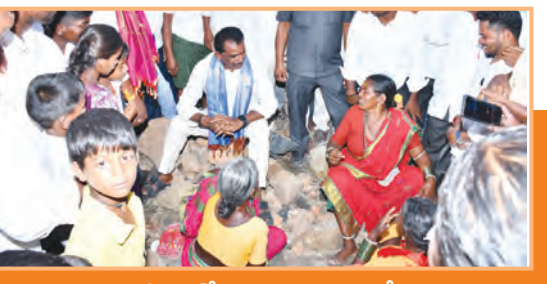
మహిళలతో మాట్లాడుతున్న ఎమ్మెల్యే