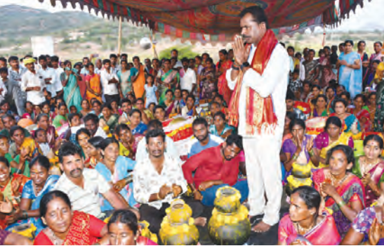
బోడ లింగమయ్యకు ప్రత్యేక పూజలు చేస్తున్న ఎమ్మెల్యే